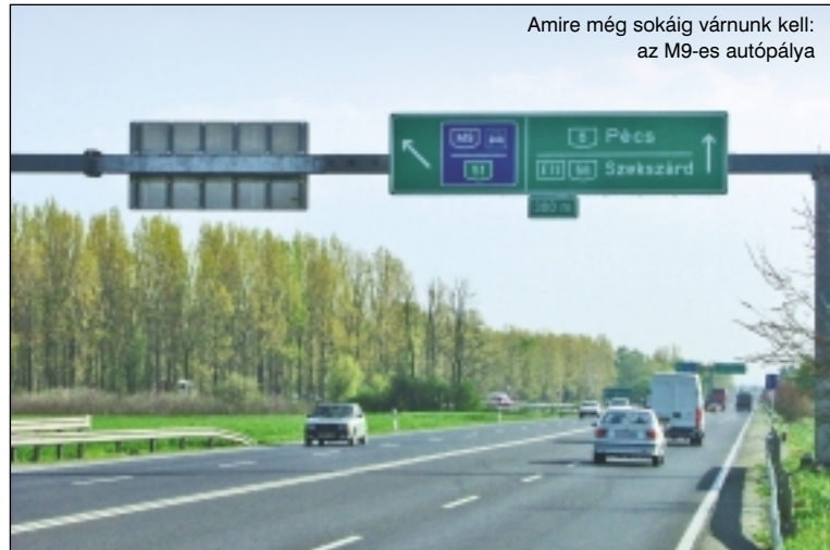
Amire még sokáig várunk kell: az M9-es autópálya

Dr. Navracsics Tibor, a Fidesz országgyűlési képviselőcsoportjának vezetője hangsúlyozta, a vidék versenyképessége, a jövő Magyarországa elképzelhetetlen fejlett közúthálózat nélkül. Sajnos Dél-Dunántúl megyéi e tekintetben jelentős elmaradásban vannak, hiszen évek óta csak ígéreteket hallanak az M6-M56-os és az M9-es utak megépítéséről. Az egyetlen ténylegesen megvalósult eredmény éppen a polgári kormány döntésének köszönhető: elkészült a szekszárdi Duna-híd és a hozzá vezető autót, amely a leen-