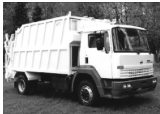
A régiós program részeként hamarosan több településen korszerű utcai lakossági hulladékszállító gépek is munkába állnak