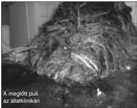
A megölt puli az állatklinikán

A rendőrség jelenleg is vizsgálja az ügyet. A gyanúsított vadásztól az azonosítás miatt elvették a fegyvereket. Várhatóan állatkínzás vétsége miatt bíróság elé kerül majd. -kb-