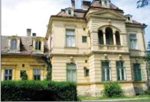
A katalinpusztai kastély ma

lyát nemcsak az emeletes északi szárnyal, könyvtárral, hanem kápolnával is kiegészítette. Vallásos ember lévén gondoskodott arról, hogy vasárnaponként mise is legyen, ahol nemcsak a család, hanem a cselédség és a szomszédos uraságok is rendszeresen részt vettek.