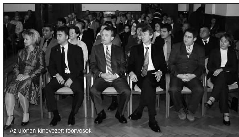
Az újonnan kinevezett főorvosok