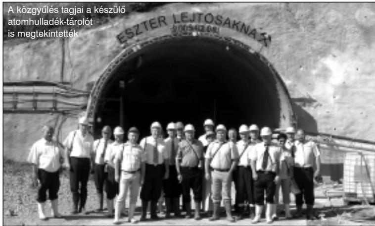
A közgyűlés tagjai a készülő atomhulladék-tárolót is megtekintették.

A képviselők döntöttek az Általános Művelődési Központ átszervezéséről is. Megszűnik az intézmény önállósága. A jövőben kisebb létszámmal és a Tolna Megyei Önkormányzati Hivatal által biztosított irodákban látja el feladatait az ÁMK. Az Esélyek Háza július 1-jétől nem a megyei önkormányzat, hanem a regionális munkaügyi központ finanszírozásában működik tovább. Az ÁMK átszervezésével jelentős költségeket takarít meg az önkormányzat. Az idegenforgalommal kapcsolatos kötelező feladatok eddigieknél hatékonyabb és kevesebb anyagi ráfordítással történő ellátása indokolja a Tolna Megyei Turisztikai Kht. megszüntetését. Ennek kezdeményezéséről is döntöttek a képviselők.