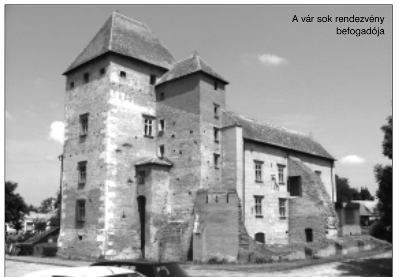
A vár sok rendezvény befogadója