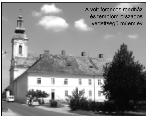
A volt ferences rendház és templom országos védettségű műemlék

– Leghíresebb épületünk a vár, ami köré számtalan rendezvény szerveződik. Éppen most zajlanak a Simontornyai Színházi Nyár eseményei megannyi ismert és elismert színész, énekes, együttes és művész fellépésével.