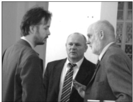
Széles András Fidesz frakcióvezető Pécsi Gábor képviselővel és Tóth Ferenc országgyűlési képviselővel egyeztet a közgyűlés szünetében

A Dél-Dunántúli Regionális Operatív Programhoz kapcsolódó megyei cselekvési tervről is határozat született. A főbb fejlesztési célok között szerepel a megyei könyvtár és levéltár építése a volt laktanya területén, a régi megyeháza rekonstrukciója, valamint a megyei kórházban az orvos- és nővérszálló bővítése, felújítása, a sürgősségi és a járóbeteg-ellátás fejlesztése.