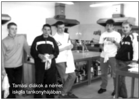
Tamási diákok a német iskola tankonyhájában

dányban elkészült német-magyar szakácskönyvük. A kétnyelvű ételrecepteket a tanulók nemcsak összegyűjtötték, de meg is főzték. A magyar fiatalok elsajátították a zelleres krumpplileves, a leutzschi kocsisült technikáját, viszonzásul pedig megtanították többek közt a székelygulyás, és a túros csusza elkészítését. Ó.J.