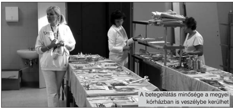
A betegellátás minősége a megyei kórházban is veszélybe kerülhet