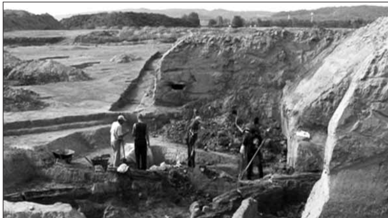
Régészeti feltárás a leendő M6 nyomvonalán, Bátaszék és Alsónyék között. A megyei múzeumoktól ezt a feladatkört elvette a szaktárca, és egy új szakszolgálatra bízta. A Tolna Megyei Közgyűlés tiltakozásul Alkotmánybírósághoz fordul