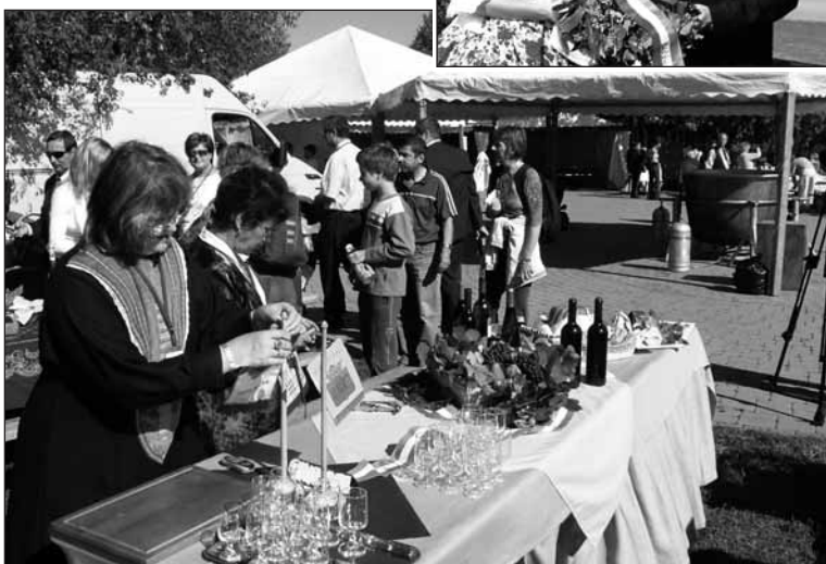
Az „Ország asztalánál” jellegzetes Tolna megyei borokat, sajtókat, valamint a híres váraljai kuglófot kínálta a megye

Az emlékparkban az „ország asztalánál” kínálták a megyék helyi specialitásait. Tolna megye asztalánál a székszárdi borvidék kiváló borait, a Tolnatej Zrt. termékeit és a váraljai kuglófot kóstolhatták meg az érdeklődők. Megyénk bemutatója nagy sikert aratott, amit mi sem bizonyít jobban, mint a nap végére üresen maradt asztal. A délutáni programok között – illeszkedve az esemény üzenetéhez és méltóságához – fellépett a Kormorán együttes. A szervezők és résztvevők – a korábbi megyei találkozókkal is összehasonlítva – magas színvonalúnak ítélték az Árpád emlékvé tiszteletére szervezett rendezvényt. Réger Balázs