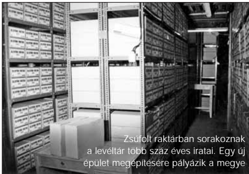
Zsúfolt raktárban sorakoznak a levéltár több száz éves iratai. Egy új épület megépítésére pályázik a megye.

módosítását, így a közgyűlés döntése formálissá vált az ügyben.