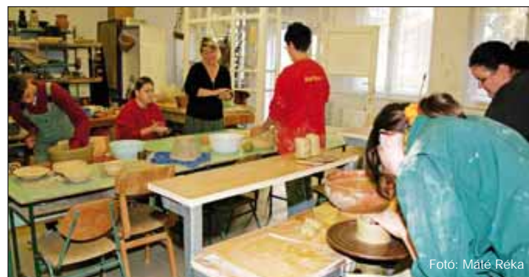
Veszélybe kerülhet a régió egyetlen népi kézműves szakmákat oktató középiskolája Bonyhádon

Tolna megyében az előző tanévben még 11 szakképző iskola működött. Most 9 van, de számuk tovább csökken, mert az uniós forrásokra csak nagyobb, összevont intézmények pályázhatnak. A másik jelentős változás a modulok oktatásra való áttérés. Legkésőbb 2008 szeptemberében át kell állni, ami a tanárok és a diákok számára sem lesz egyszerű. A szakmákat, szakmárészekre – modulokra – bontva oktatják majd az összevont, legalább 1500 tanulóval számoló intézményekben. A közműves szakmát például hat modulra bontják – falazás, vakolás, burkolás stb. –, és aki mind a hat modulra végzett, összevont szakmunkásvizsgát tehet. De aki megelégszik hárommal, azzal is boldo-