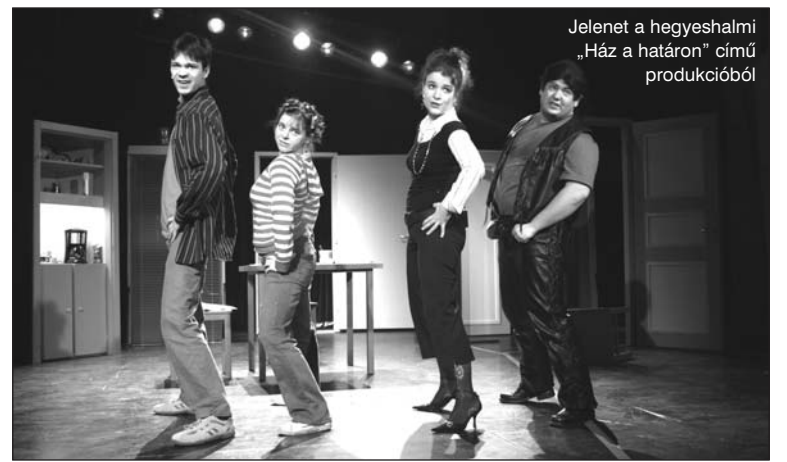
Jelenet a hegyeshalmi „Ház a határon” című produkcióból