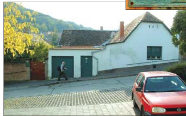
Szekszárd, Babits Mihály u. 16., ebben a házban működött Lengyel Pál nyomdája, ahol a Lingvo Internacia esperantó nyelvű lapot adták ki 1901–1904 között

(A mindössze 10 éves nyelv létrehozója Zamenhof Lajos Lázár szemorvos volt, akit mélységesen bántott, hogy szülővárosában, Bialystokban az egymást gyűlölő lengyelek, oroszok, németek és zsidók között napirenden voltak a véres összeütközések. Azt hitte, ennek oka egymás meg nem értése. De ha létezik egy könnyen megtanulható hídnyelv, akkor az emberek békésen élnek egymás mellett. Ezért adta ki Varsóban, 1887. július 26-án, Doktoro Esperanto