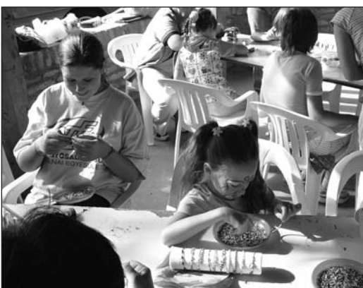
A tolnai családi Duna-partyn kézműves foglalkozások is várták a gyerekeket