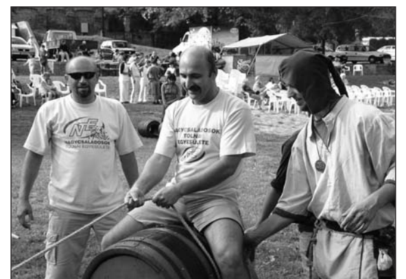
A családok felnőtt tagjai is bekapcsolódhattak a programokba