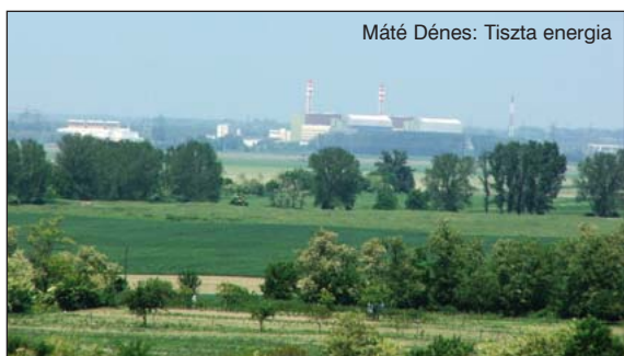
Máté Dénes: Tiszta energia