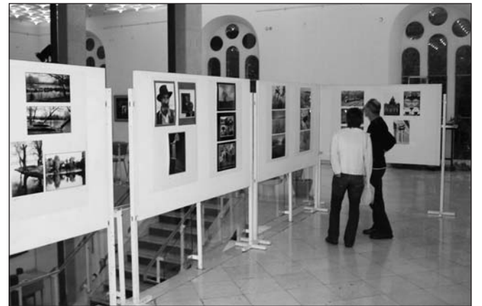
„Az Én Tolna Megyém” fotókiállítás szeptember 14-ig látható Szekszárdon, a Művészetek Házában