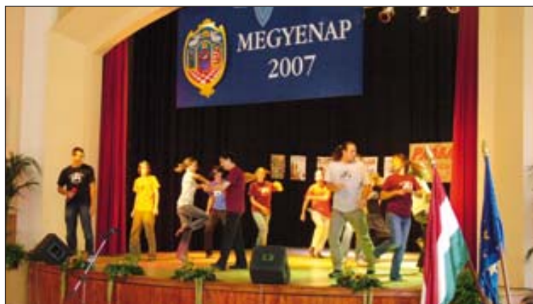
Tolnán az ünnepi közgyűlést a Bátaszéki Színháztársulat gazdagította műsorával