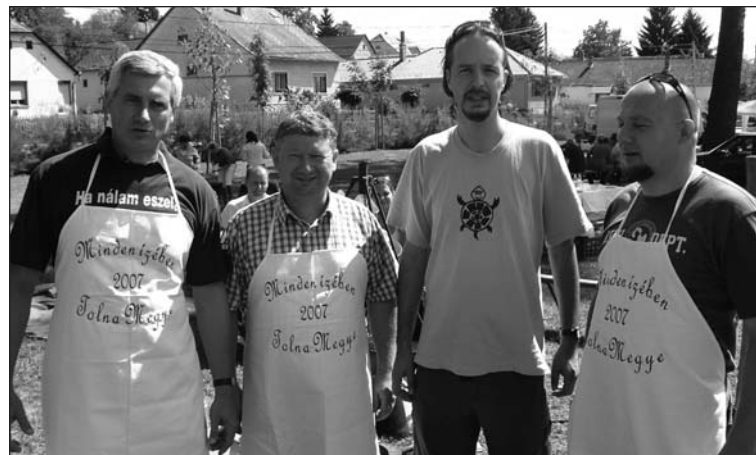
„Minden ízében Tolna megye” – többek között Tolna, Tamási és a Tolna Megyei Önkormányzat is jelen volt a zombai gasztronómiai találkozón