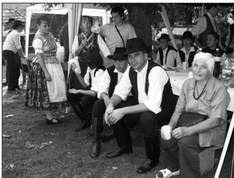
Fellépésre vár a Felvidéki Táncsoport