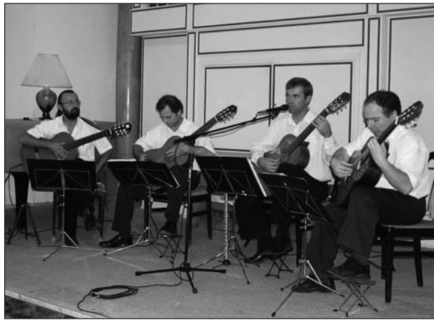
Az ünnepi hangversenyen fellépett a Szekszárdi Gitárkvartett