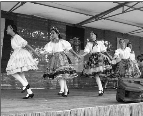
Hagyományörző együttesek színesítették a gasztronómiai találkozót