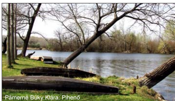
Pámerné Büky Klára: Pihenő