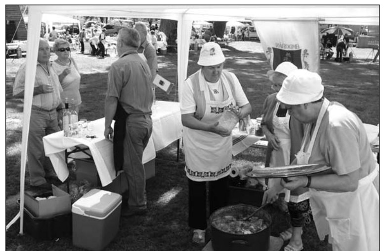
Zombán 50 bográcsban főttek a megye ízei