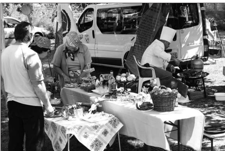
Főz a megye