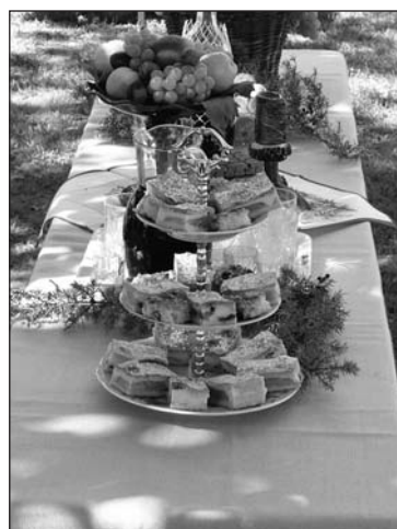
Terített asztal várta a vendégeket és a zsűrit